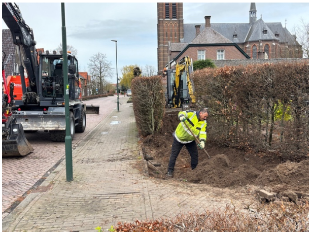
Foto: de heg bij het kerkhof is al verplaatst om ruimte te maken voor de nieuwe kruising; dit in verband met het plantseizoen.

Op 15 januari 2026 heeft de gemeente het voorlopig ontwerp van de reconstructie van het kruispunt (St. Antoniusstraat, Lochterweg, Oude Molenweg en Renseweg) laten zien aan omwonenden. Op deze avond zijn aandachtspunten over de kruising en het ontwerp opgehaald. Hier is de gemeente mee aan de slag gegaan en het voorlopig ontwerp is op diverse punten aangepast. Dit wil men weer graag met de inwoners van De Mortel delen om te toetsen of de gemeente verder kan richting een definitief ontwerp. Daarom nodigt de gemeente alle belangstellenden uit voor de informatieavond op woensdag 15 april in De Sprank van 19.00 – 21.00 uur.